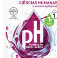
Caderno de Ciências Humanas e Sociais Aplicadas