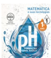
Caderno de Matemática e suas tecnologias