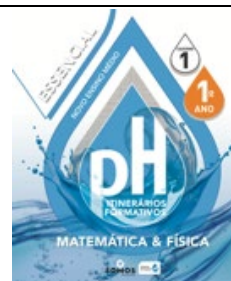
Matemática e Física