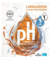
Caderno de Linguagens e suas tecnologias