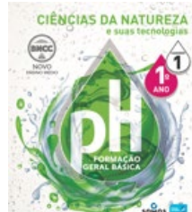
Caderno de Ciências da Natureza e suas tecnologias